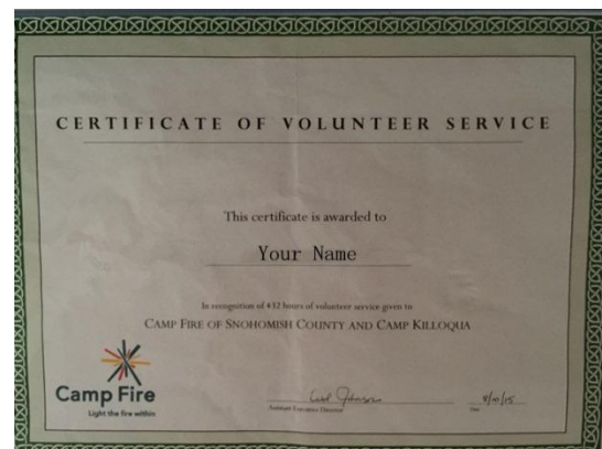
志愿单位志愿证明示例